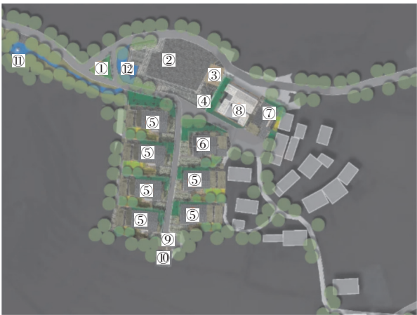
①村子logo;②村口广场、停车场、打谷场;③公共卫生间;④连廊; ⑤100 m 2 民居;⑥75 m 2 民居;⑦65 m 2 民居;⑧示范户; ⑨回车场、打谷场;⑩瞭望亭;⑪清泉池;⑫村口水景

现代人的生活起居习惯与古代人存在一定的差异,但传统园林建筑美学设计中人性化的功能设计与布局,仍然符合当今乡村居民的基本居住需求。