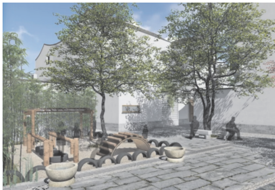
图3 乡村民居空间处理手法图例

化,提升公众对国家、民族精神文化面貌的认知 [17] 。下面从空间布局、功能分区、空间形式、整体风貌几个方面探讨中国传统园林建筑美学思想对现代乡村民居建筑设计的启示。