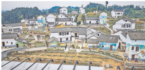
图1 乡村民居生活场所与自然环境相互交融图例

“天人合一”哲学思想一直以来都是中国传统园林建筑的核心建造理念。其中,“天”代表自然环境,“合一”代表人与自然的和谐共处。明末造园家计成认为,园林建造应遵循“虽由人作,宛自天开”的原则,即在建造园林时应尽可能消除人工参与的痕迹,让园林呈现出一种与周围环境融为一体的自然形态 [11] 。在他的著作《园冶》中,对园林建设艺术进行了比较详细的阐述,认为园林整体布局应做到“格式随宜”,尽量不破坏原有的自然环境,在景观设计方面应秉承“自然古木繁花”的宗旨,强调生活场所与自然环境的相互交融 [12] 。他认为,园林建设应在保护自然环境的基础上,自然融入自然环境,实现生活空间与自然环境的和谐统一。将这种观念应用于现代美丽乡村建设,既是对“美丽乡村”建设工作的有效助力,也同时成为保护自然可持续、再利用的典范,具有极佳的景观和实用价值 [13] 。特别是在乡村民居的生活场所,园林呈现出一种与周围环境的融合,也可谓“天人合一”的神来之笔(图1)。