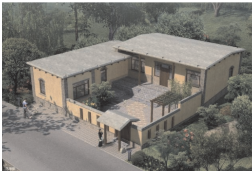
图5 乡村民居空间形式变化图例

中国幅员辽阔,历史悠久,不同地区拥有不同的文化习俗和风土人情,在进行美丽乡村建设时,应充分考虑这一点,将独具地域特色的文化艺术内容合理融入乡村民居建筑当中,以此实现优秀地域文化的传承与发展,呈现出丰富多样的乡村民居建筑群落。这样的设计方式,不仅可以实现乡村民居建筑与当地人文环境、自然环境的和谐统一,还可以赋予地方民居建筑独有的文化艺术内涵,吸引更多外来者的目光,进而促进当地文化经济的可持续发展 [21] 。设计中保留水车、石刻等当地原住乡土要素,能够保持“美丽乡村”的建设要求,提高乡村民居设计水准。将其合理融入新建筑当中,利用这些能够充分体现乡村居民生活劳动特色的元素,赋予新建筑丰富的生活气息和深厚的历史文化内涵。此外,在选择建筑材料时,可以选用性价比高的新型建筑材料,辅以乡村地域范围内的本土建筑要素,注重传统园林美学设计理念,对二者进行深度融合,使建筑风格呈现自然乡土与传统立体、平面关系的有机转换。