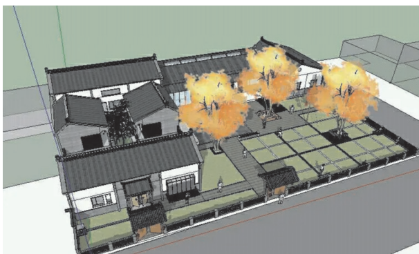
图4 乡村民居功能分区图例

统园林空间的设计策略,考虑乡村居民生活、生产的双线轨迹,利用合理的传统园林布局原则,规划与城市居民不同的生产环境,为乡村居民生产创设舒适条件。此外,乡村居民生活、生产用具较多,可以在不同楼层设置夹层等,充分利用立体空间,形成具有动态私密性和高使用率的乡村民居建筑空间,实现乡村民居功能分区的集约、高效。需要注意的是,传统园林建筑美学设计理念对立体空间的使用功能提出了更高的要求,需要适当增加空间的垂直变化,合理安排交通动线,以此提高民居建筑的趣味性,增强民居建筑的表现力 [20] 。乡村民居具有园林布局的各功能分区展示见图4。